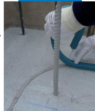
Полагане на Idrostop Soft по хоризонтални повърхности

Всички съответни справки за продукта са налични при заявка и на интернет адрес www.mapei.com