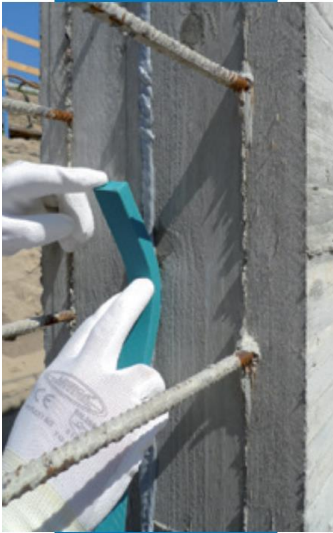
Полагане на Idrostop Soft по вертикални повърхности